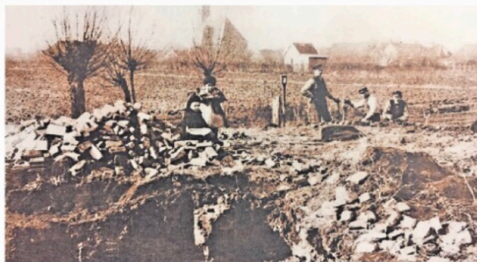
▲ Het ruimen van de restanten van klooster Leliëndale in Burgh-Haamstede in 1899. Foto in boek Kloosterrijk Schouwen.