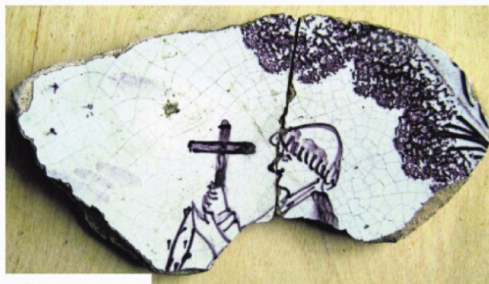
▲ Tegelfragment gevonden in de buurt van het klooster van de Grauwe Zusters in Haamstede. Foto in boek Kloosterrijk Schouwen. FOTO UITGEVERIJ WALBURGPERS

De informatie over de verdwenen kloosters is na die routebeschrijving samengebracht in het tweede deel van het hoofdstuk. Beperken we ons hier tot route Noordwelle-west, dan gaat het om het nonnenklooster Leliëndale in Burgh-Haamstede. Het lag pal naast het gereconstrueerde deel van de Karolingische burch waar sportpark Van Zuijlen is. Dalebout heeft in archieven en eerdere publicaties veel vermeldingen van het klooster Leliëndale gevonden. De mooiste komt uit het in 1530 opgemaakte rapport van een keizerlijke commissie die de door de Sint Felixvloed veroorzaakte schade moest opnemen. Op 7 december van dat jaar